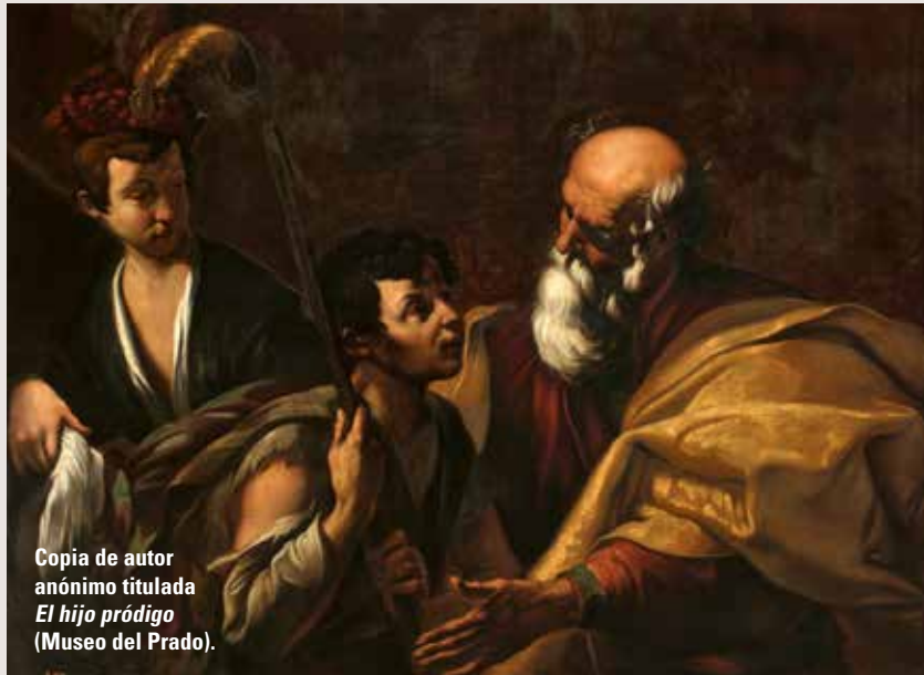
Copia de autor anónimo titulada El hijo pródigo (Museo del Prado).

Jesús insiste en presentar la conversión como el regreso de los hijos al Padre.