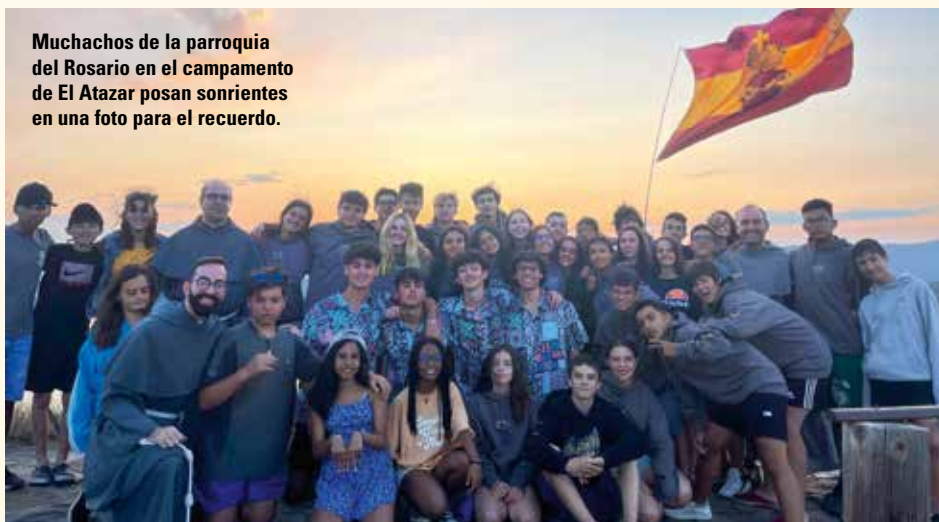
Muchachos de la parroquia del Rosario en el campamento de El Atazar posan sonrientes en una foto para el recuerdo.

Del 16 al 22 de julio, varios chicos de la parroquia Nuestra Señora del Rosario, en Madrid, hemos disfrutado del campamento diocesano de El Atazar junto a otras parroquias de la Vicaría VI.