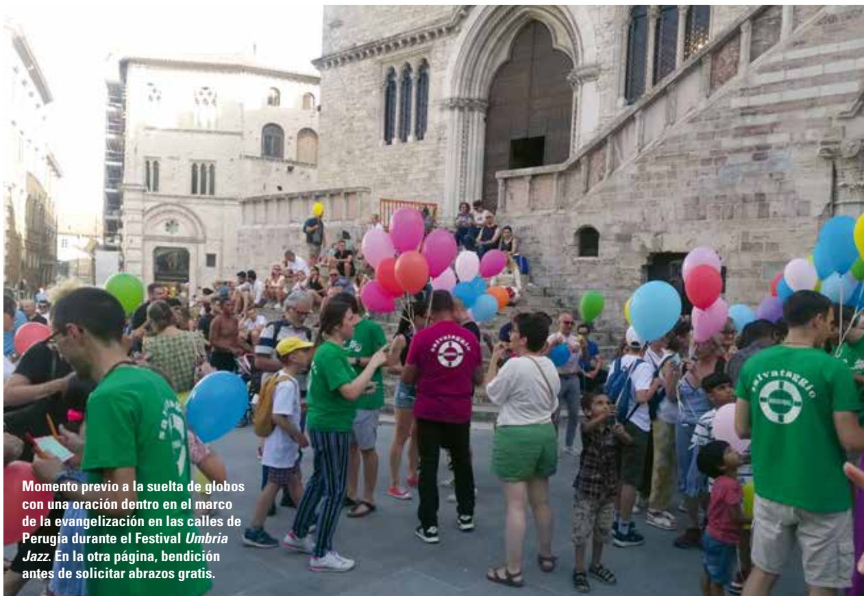
Momento previo a la suelta de globos con una oración dentro en el marco de la evangelización en las calles de Perugia durante el Festival Umbria Jazz. En la otra página, bendición antes de solicitar abrazos gratis.

se acerque a una iglesia donde está el Santísimo expuesto. Allí les esperan otros evangelizadores que están orando, ofreciéndoles una candela para poner a los pies del Señor.