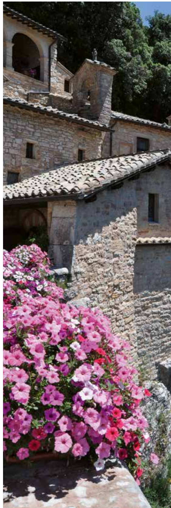
Vista parcial del eremitorio franciscano de Las Cárceles, situado en la falda del monte Subasio, a las afueras de Asís.

Depósito legal: B-26306-05. Imprime: Gráficas Dehon. C/ Morera 23-25. 28850 Torrejón de Ardoz (Madrid). © No se permite la reproducción total o parcial de artículos y fotografías sin una autorización expresa de la dirección de la revista, que se publica, trimestralmente, en los meses de marzo, junio, septiembre y diciembre.