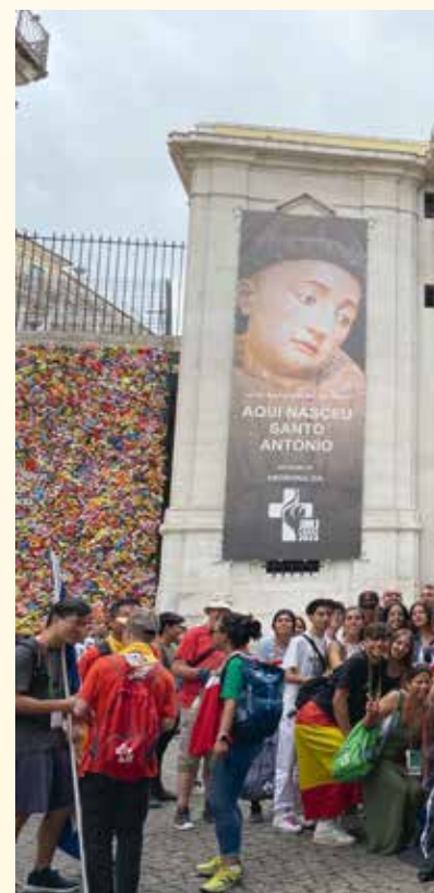
Tres jóvenes oran en el lugar donde nació san Antonio. Arriba, foto de grupo de los jóvenes procedentes de Madrid ante la casa natal del Santo.

El jueves 3 por la mañana participamos en la catequesis y la eucaristía en español en el Barrio Alto, con unas vistas preciosas de la ciudad. Después