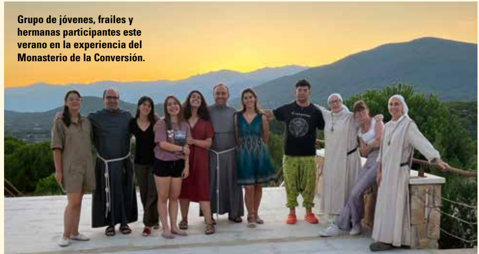
Grupo de jóvenes, frailes y hermanas participantes este verano en la experiencia del Monasterio de la Conversión.

Este verano, al haber cumplido la mayoría de edad y después de haber participado ya dos años en el campamento de El Atazar, los frailes de la parroquia nos propusieron participar en un proyecto diferente.